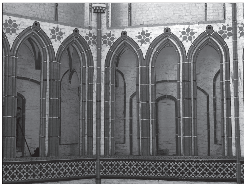
Ilustr. 11. Kościół NMP w Stargardzie, galerie nad obejściem chóru, wg stanu z 18 czerwca 2012 r.