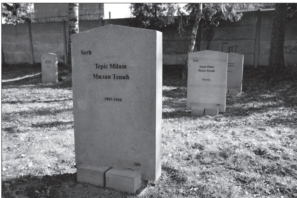
Ilustr. 9. Nowe płyty nagrobne jeńców serbskich zmarłych w Stalagu II D i pochowanych na Międzynarodowym Cmentarzu Wojennym w Stargardzie przy ul. W. Reymonta, wg stanu z 5 marca 2012 r.