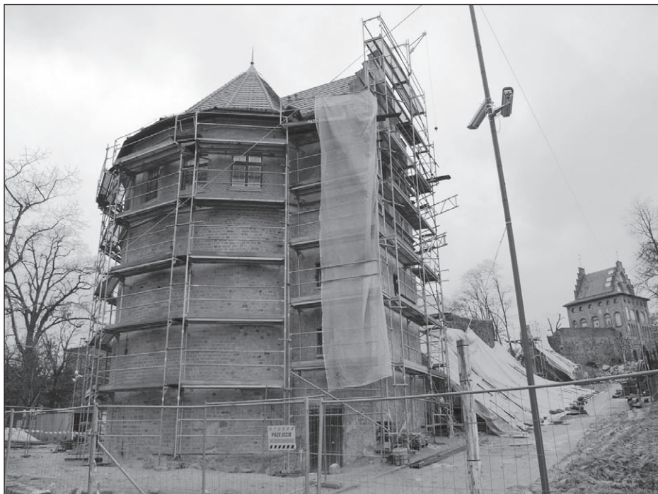
Ilustr. 6. Remont i rozbudowa Bastii, wg stanu z 9 stycznia 2012 r.