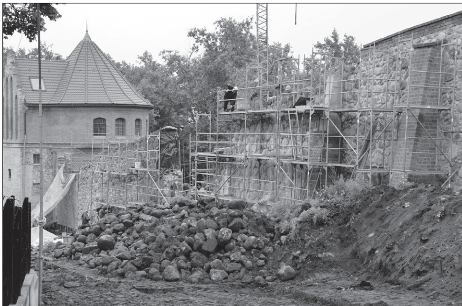
Ilustr. 8. Remont i rozbudowa Bastii – fragment remontowanych murów miejskich przy ul. Sukienniczej, wg stanu z 11 października 2012 r.