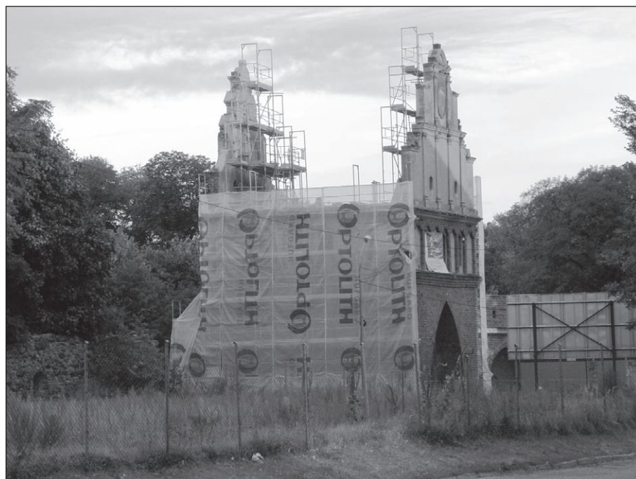
Ilustr. 13. Brama Wałowa podczas prac remontowych, widok od strony północno-zachodniej, wg stanu z 11 października 2012 r.