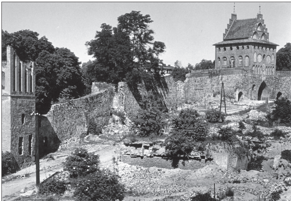
Ilustr. 4. Zachodni odcinek murów miejskich w Stargardzie przy ul. Sukienniczej pomiędzy Basteją a Bramą Pyrzycką, wg stanu z lipca 1956 r. Zakup od Antykwariatu „Wu-eL”.