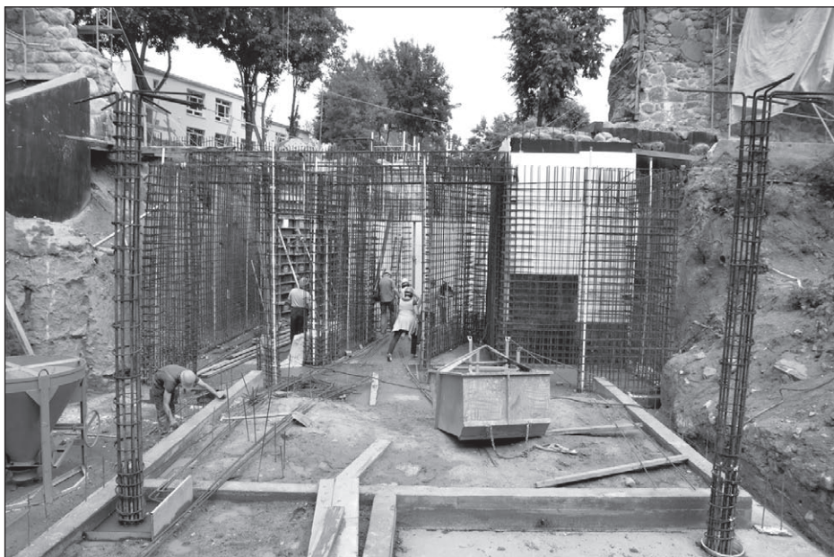
Ilustr. 7. Remont i rozbudowa Bastii - budowa recepcji i nowego wejścia do obiektu, wg stanu z 11 lipca 2013 r.