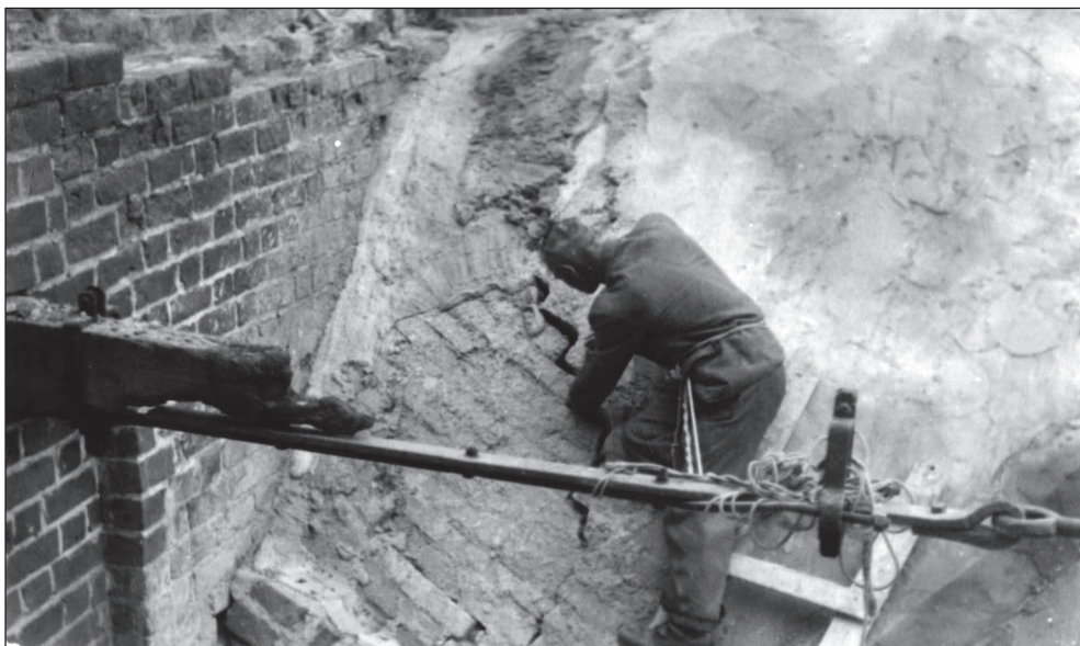
Ilustr. 5. Prace przy rekonstrukcji sklepienia Kościoła NMP w Stargardzie, wg stanu z lat 50. XX w. Zakup od Antykwariatu „Wu-eL”.