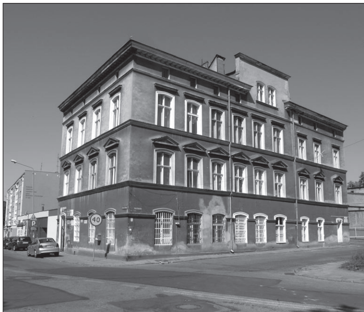
Ilustr. 2. Kamienica przy ul. Bolesława Chrobrego 21, 21a, wg stanu z 30 maja 2011 r.