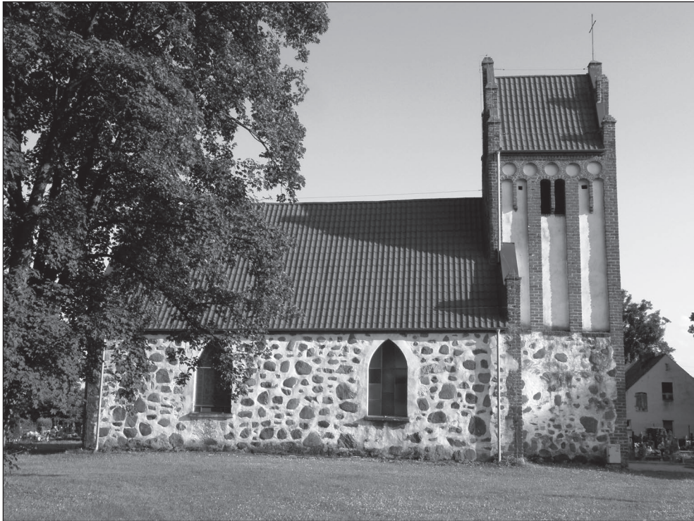
Ilustr. 14. Kościół filialny p.w. św. Józefa Oblubieńca w Małkocinie, widok od strony północnej, wg stanu z 10 lipca 2012 r.