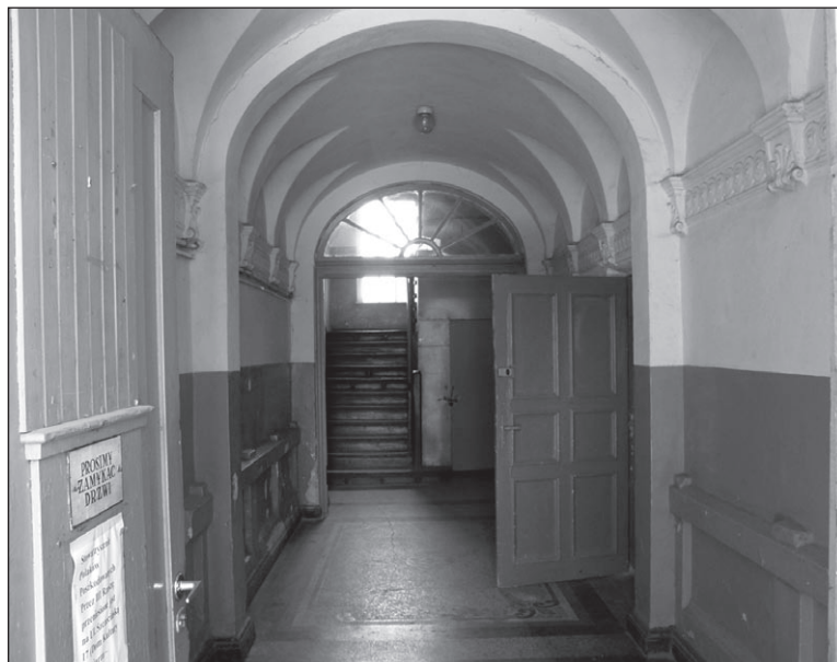
Ilustr. 3. Wnętrze kamienicy przy ul. Bolesława Chrobrego 21, 21a, wg stanu z 30 maja 2011 r.