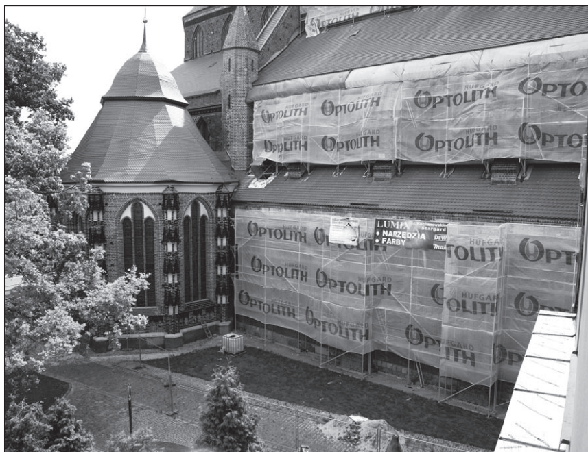
Ilustr. 10. Kościół NMP, remont północnej ściany korpusu głównego pomiędzy masywem wieżowym, a Kaplicą Mariacką, wg stanu z 6 sierpnia 2012 r.